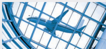
Авиационное финансирование и лизинг в России и СНГ