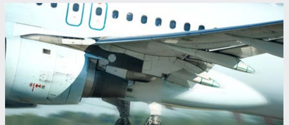
Форум «Крылья будущего»