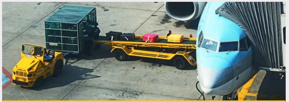
Наземное обслуживание в аэропортах