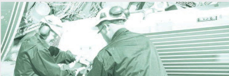
ТОиР авиационной техники в России и странах СНГ